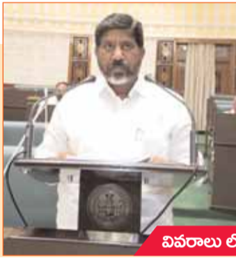
వివరాలు లోపలి పేజీలో