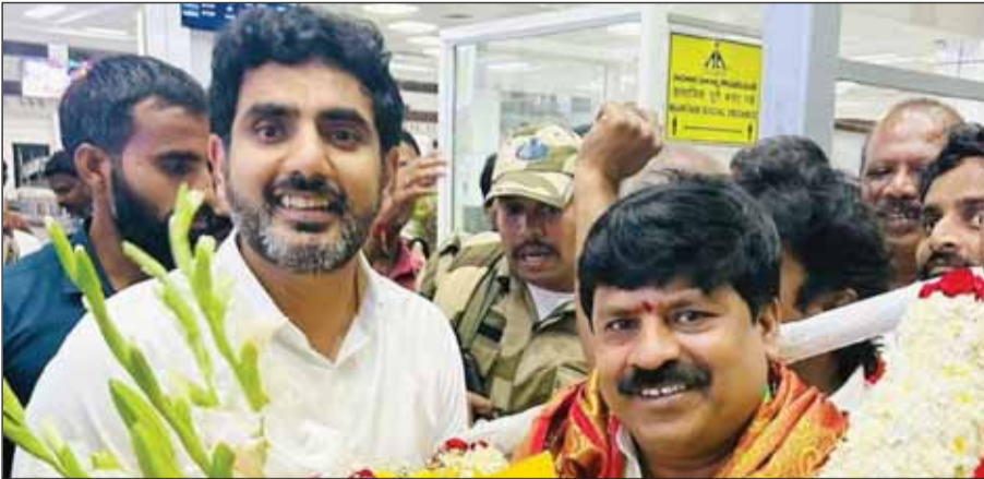
పాటు సాగి శంఖారావం యాత్రలో 31 నియోజకవర్గాల నున్నారా. రేపు తొలి రోజు ఇచ్చావరం, పల్నాడు, టెన్కలి కల నేపథ్యంలో కార్యకర్తలకు దిశా నిర్దేశం చేయ

రోడ్డుమార్గాన ఇచ్చావరం బయల్దేరారు. ఇచ్చావరంలో రేపటి శంఖారావం కోసం టీడీపీ రాష్ట్ర అధ్యక్షుడు కింజరాపు అచ్చెన్నాయుడు నేతృత్వంలో విస్తృత ఏర్పాటు చేశారు. ఇచ్చావరంలో రేపు ఉదయం 10.30 గంటలకు లోకేష్ శంఖారావం కార్యక్రమానికి శ్రీకారం చుట్టారు. శంఖారావంలో పాల్గొనేందుకు ఇప్పటికే ఉత్తరాంధ్ర నలుమూలల నుంచి టీడీపీ ముఖ్యనేతలు ఇచ్చావరం చేరుకున్నారు. నారా లోకేష్ యువగళం యాత్ర ఉత్తరాంధ్రలో వూర్తిగా జరగ కుండానే ముగిసింది. ఆ లోటును శంఖారావం యాత్ర ద్వారా భర్తీ చేసుకోవాలని లోకేష్ భావిస్తున్నారు. మొత్తం 11 రోజుల