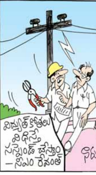
అది కట్ చేస్తే మన ఉద్యోగం 'కట్' అవుతుందట