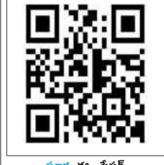
సూర్య ఈ - పేపర్