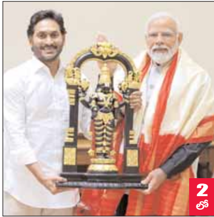
ఢిల్లీ పర్యటనకు వెళ్లిన పిపీ సీఎం జగన్ మోహన్ రెడ్డి శుక్రవారం మధ్యాహ్నం ప్రధాని నరేంద్ర మోడీ తో భేటీ అయ్యారు. ప్రధానికి శాలువా కప్పి సత్కరించారు. ఆయనకు వెంకటేశ్వరస్వామి ప్రతిమను బహూకరించారు.