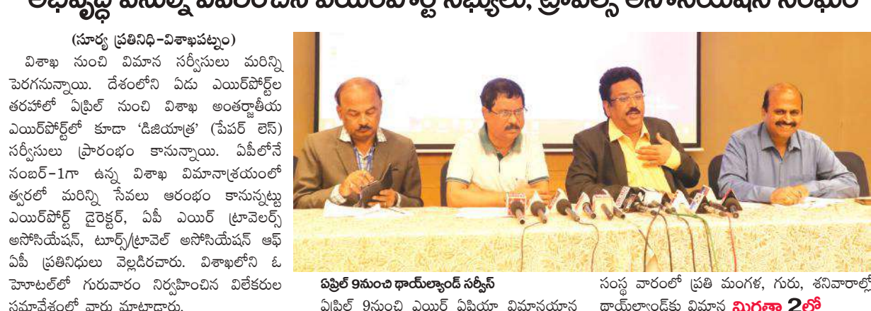
ఫిబ్రవరి 9న ఉప ధారుల్గాండ్ సర్వీస్ సంస్థ వారంలో ప్రతి మంగళ, గురు, శనివారాల్లో ఏప్రిల్ 9 నుంచి ఎయిర్ ఏషియా విమానయాన ధారుల్గాండ్ కు విమాన మిగతా 2లో

మాల్దీ తర్వాత మరిన్ని సర్వీసులు ఏప్రిల్ నుంచి ధారుల్గాండ్ కు సర్వీసులు అభివృద్ధి పనుల్ని ఏవరించిన ఎయిర్పోర్ట్ సభ్యులు, ట్రావెల్స్ అసోసియేషన్ సంఘం