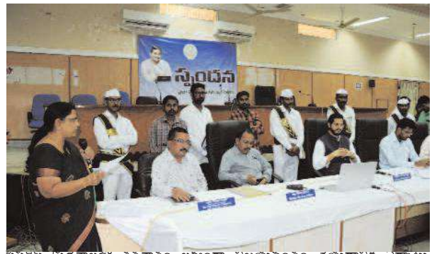
ఫిషరీస్ ప్రదేశాలలో శతశాతం లక్ష్యంగా ఏజయివంతం చేయడానికి ఏర్పాటు చేయాలని సూచించారు. ఈ కార్యక్రమంలో జిల్లా వైద్య ఆరోగ్యశాఖాధికారిణి డాక్టర్ బి మీనాక్షి, జిల్లా ఇమ్మునైజేషన్ అధికారి ఈశ్వరి, జిల్లా పంచాయతీ అధికారి వెంకటేశ్వర్లు, గ్రామీణ అభివృద్ధి సంస్థ ప్రాజెక్టు డైరెక్టర్ డా విద్యా సాగర్, జిల్లా మాన్ మీడియా అధికారి పైడి వెంకటరమణ, రవాణా, విద్యుత్ శాఖ అధికారులు తదితరులు పాల్గొన్నారు.

- జిల్లా కలెక్టర్ డా. మనజీర్ జీలాని సమాన్ శ్రీకాకుళం, ఫిబ్రవరి 26, మేజర్‌స్ట్యాఫ్: అప్పుడే పుట్టిన బిడ్డ నుండి ఐదు సంవత్సరాలలోపు పిల్లలకు పోలియో చుక్కలు వేయడం జరుగుతుందని జిల్లా కలెక్టర్ డా. మనజీర్ జీలాని సమాన్ అన్నారు. కలెక్టర్లే సమావేశ మందిరంలో సంబంధిత అధికారులతో సమావేశం నిర్వహించారు. కలెక్టర్ మాట్లాడుతూ ఫిబ్రవరి 03న, అప్పుడే పుట్టిన బిడ్డ నుండి 5 సంవత్సరాల లోపు పిల్లలకు పోలియో చుక్కలు వేయటం చర్యలు చేపట్టడం జరిగిందన్నారు. అలాగే 4,5 తేదీల లో కూడా వేయనున్నట్లు తెలిపారు. ప్రతి ఒక్కరికి సందేశం చేరేలా విస్తృత ప్రచారం నిర్వహించాలన్నారు. 1,79,984 మంది 5 సంవత్సరాలలోపు పిల్లలకు 1232 పోలియో బూత్ లు, 50 ట్రాన్సిట్ బూతులు ఏర్పాటు చేయడం జరిగిందని అన్నారు. 78 మొబైల్ టీములు, 121 సూపర్వైజర్ బృందాలుగా ఏర్పడి 3,12,000 డోసులు వేయడానికి ఏర్పాటు పూర్తయ్యాయిన్నట్లు తెలిపారు. మొబైల్ టీములు ప్రత్యేక బృందాలుగా ఏర్పడి అన్ని సంచార జాతుల వారి పిల్లలకు, ఇటుక బద్దీలు నిర్వహించు వారి పిల్లలకు, నిర్మాణ స్థలాలు మరియు