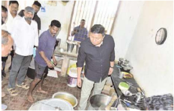
అటలు ఆరోగ్యం ముఖ్యమని ఆఫీసుగా ఉపాధ్యాయులు ముందుకు పోవాలని సూచించారు.