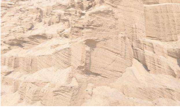
అయ్యవారిపేట 2 ఇసుక క్వారీ తనిఖీ చేసి తగు చర్యలు తీసుకోవాలని గ్రామ ప్రజలు కోరుతున్నారు.

వాజేడు జనవరి 31 మేజర్ న్యూస్ సూర్య: ములుగు జిల్లా వాజేడు మండలం లోని అయ్యవారిపేట పంచాయతీ పరిధిలోని అయ్యవారిపేట 2 ఇసుక క్వారీలో రేసింగ్ కాంట్రాక్టర్ ఇష్టారాజ్యం వ్యవహరిస్తున్నారు. ప్రభుత్వం నిర్దేశించిన లోతుకు మించి ఎక్కువ లోతులో ఇసుక తోడి బయట ప్రదేశానికి తరలించి గుట్టలు గుట్టలుగా పేర్చి అక్కడినుంచి లారీలో తరలిస్తున్నారు అంతేకాకుండా ప్రతి లారీ రెండు నుంచి మూడు బకెట్లు అధికంగా వేస్తూ ప్రభుత్వ ఆదాయానికి గండి కొడుతున్నారు. దీని వైపు అధికారులు కనుచూపులో కూడా చూడకపోవడంతో వారు చేసిందే చేత ఆడిందే ఆట వలె ఇస్టారాజ్యం కొనసాగుతుంది. మైనింగ్ అధికారులకు అధికారికి సమాచారం ఇచ్చిన ఆ క్వారీ వైపే చూడకపోవడం అంతేకాకుండా బహిరంగంగానే రేసింగ్ కాంట్రాక్టర్లు అందరికీ ముట్టినవి అని చెప్పడం విశేషం. ఎక్కువ లోతు ఇసుక తీయడంతో పంట పొలాలకు బోరు బావుల నుండి వచ్చే నేరు రాకుండా పోతుందనే ఆందోళనలో ఆ చుట్టుపక్కల రైతులు ఉన్నారు. ఎవరికి చెప్పినా పట్టించుకోవడం లేదని ఆందోళన వ్యక్తం చేస్తున్నారు. ఇకనైనా అధికారులు స్పందించి