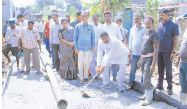
పార్టీ నియోజకవర్గ, మండల, గ్రామస్థాయి నాయకులు పాల్గొన్నారు.