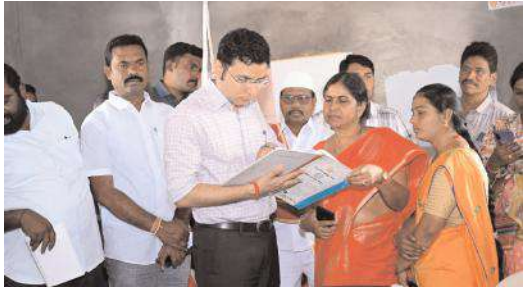
పదవ తరగతి విద్యార్థులపై