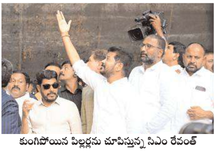
కుంగిపోయిన పిల్లల్లను చూపిస్తున్న సిఎం రేవంత్