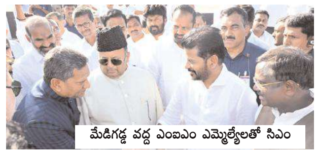
మేడిగడ్డ వద్ద ఎంఐఎం ఎమ్మెల్యేలతో సిఎం