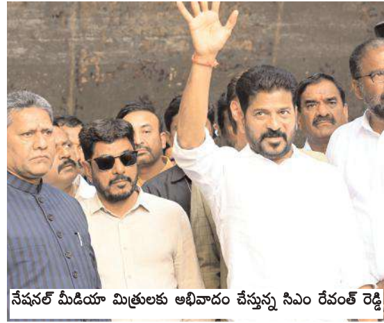
నేషనల్ మీడియా మిత్రులకు ఆభివాదం చేస్తున్న సిఎం రేవంత్ రెడ్డి