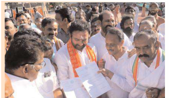
వరంగల్ మహానగర అభివృద్ధికి