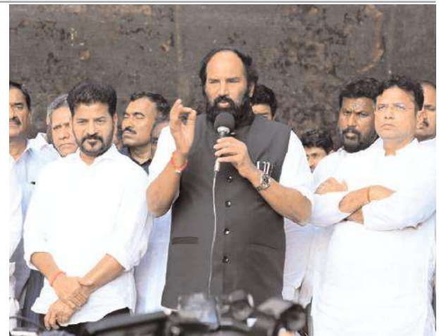
నామ మాత్రపు కొత్త ఆయకట్టు తయారు చేశారని మంత్రి ఉత్తం కుమార్ రెడ్డి అన్నారు.

ఎకరాలకు నీళ్ళిచ్చారని వివరించారు. ప్రాజెక్టు నిర్మాణం కొరకు అధిక వడ్డీలకు అప్పులు తెచ్చి ప్రాజెక్టు కట్టారని 38 వేల కోట్ల ప్రాజెక్టు ను రీ డిజైన్ పేరుతో 94 వేల కోట్ల పెంచి ఖర్చు పెట్టారన్నారు. ప్రాజెక్టు పూర్తి కాకున్నా పూర్తి చేసుకున్నట్లు చెప్పారని ఇంకా 30 వేల కోట్లు కర్చు చేస్తే ఈ ప్రాజెక్టు పూర్తి అవుతుందని పేర్కొన్నారు. బ్యారేజ్ కట్టి నీటిని నిల్వ చేసి ఎన్నికల ముందు పబ్లిసిటీ చేసుకున్నారు. ప్రస్తుతం మేడిగడ్డ కుంగుబాటు అనంతరం ఏ ఒక్కనాడు కెసిఆర్ మాట్లాడలేదని ఆరోపించారు. ప్రాజెక్టు లో నీటి నిలువ చేస్తే భారీ ప్రమాదం జరిగేదని అన్నారు. కాశీశ్వరం ప్రాజెక్టు లో జరిగిన కుంభకోణం పై చట్ట ప్రకారం చర్యలు తీసుకుంటామని అన్నారు. మేడిగడ్డ బ్యారేజి ఫెయిల్యూర్ అని నేషనల్ డ్యాం సేఫ్టీ అధికారులు ముందే చెప్పారని ఉత్తమ్ పేర్కొన్నారు. మేడిగడ్డ పై పూర్తి అధ్యయనం చేసిన తర్వాత ఎక్స్పర్ట్ తో పూర్తి సమాచారం తో డ్యాం సేఫ్టీ అధికారుల సూచనల తో ముందుకు పోతామని తెలిపారు. 94 వేల కోట్ల రూపాయల ప్రణాళనాన్ని వూధా చేసి