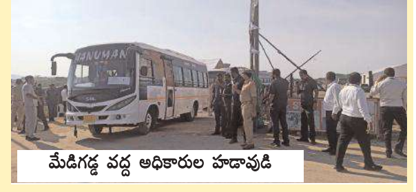
మేడిగడ్డ వద్ద అధికారుల హడావుడి

మేడిగడ్డకు సిఎం రాకతో అధికారుల హడావుడి మేడిగడ్డ బ్యారేజి వద్దకు మంగళవారం సిఎం రేవంత్ రెడ్డి, రాష్ట్ర మంత్రులు ఎమ్మెల్యేలు మధ్యాహ్నం 3.00 గంటల 30 నిమిషాలకు మేడిగడ్డకు చేరుకున్నారు. ఈ నేపథ్యంలో పోలీస్ ఉన్నతాధికారులు, జిల్లా కలెక్టర్ తో పాటు పలు శాఖల అధికారుల సందడి నెలకొంది. మంగళవారం హైదరాబాద్ నుండి రోడ్డు మార్గాన ప్రత్యేక బస్సులో సిఎం తో పాటు మంత్రులు. ఎమ్మెల్యేల బృందం. నేరుగా మేడిగడ్డ బ్యారేజి చేరుకొని మేడిగడ్డ బ్యారేజి లోని పిల్లర్లు కుంగిపోయిన ప్రదేశాన్ని గంట పాటు సందర్శించారు, ఈ సందర్భంగా మేడిగడ్డ పరిసర ప్రాంతం పోలీసుల అధికారుల కనుసన్నల్లో వుంది, కుంగిన పిల్లర్ల సందర్భం అనంతరం మేడిగడ్డ వ్యూ పాయింట్ వద్దకు చేరుకొని మేడిగడ్డ నిర్మాణ లోపాలను ఎత్తిచూపుతూ అక్కడే పవర్ ప్రజెంటేషన్ ద్వారా మంత్రులకు ఎమ్మెల్యేలు మీడియా ముందు ప్రదర్శించారు. అనంతరం పాత్రికేయుల ఇష్టా గోష్టి లో సిఎం రేవంత్ రెడ్డి పాల్గొన్నారు.