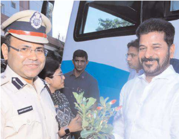
కలుసుకొని పూల మొక్కలు అం దనేశారు.