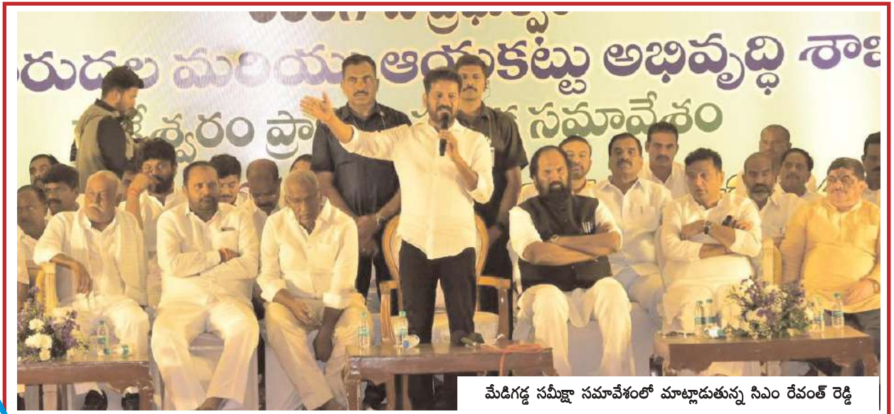
మేడిగడ్డ సమీక్షా సమావేశంలో మాట్లాడుతున్న సిఎం రేవంత్ రెడ్డి