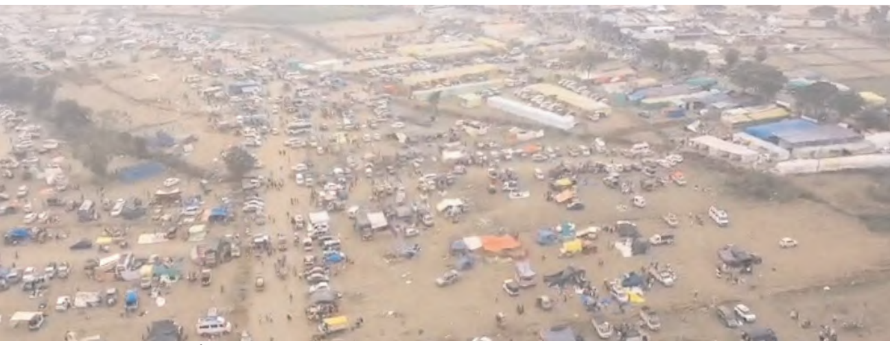
మొదటి పేజీ తరువాయి..

జాతరకు దేశం నలుమూలల నుండి పలు రాష్ట్రాల నుండి పెద్ద సంఖ్యలో భక్తులు మేడారం చేరుకుంటారు. విదేశాల్లో స్థిరపడ్డ భారతీయులు సైతం మేడారం జాతరకు వెళ్లి మొక్కులు చెల్లించుకోవడం ఏళ్ల తరబడి ఆనవాయితీగా వస్తుంది. అత్యంత వైభవంగా మహిమాన్విత తల్లులుగా చరిత్ర మేడారం జాతర. మరో రెండు రోజులు మాత్రమే గడువు ఉండగా ఇప్పటికే పెద్ద ఎత్తున మేడారం జాతర కోసం భక్తులు విడిది చేశారు. మేడారం చుట్టుపక్కల ఆరు కిలోమీటర్ల పరిధిలో భక్తజన సందోహం కనిపిస్తుంది. భక్తుల కోసం చుట్టుపక్క గ్రామాలైన రెడ్డిగూడెం, కొత్తూరు, కన్నెపల్లి, ఊరటం, ఏలుబాక తదితర గ్రామాల్లో విడి కేంద్రాలను ఆయా గ్రామస్థులు ఏర్పాటు చేశారు. సుమారు లక్షకుపైగా వ్యాపారులు మేడారం తరలివచ్చే కోట్లాదిమంది భక్తులకు సౌకర్యాల కోసం దుకాణ సముదాయం ఏర్పాటు చేసుకున్నారు. ఏది ఏమైనా మేడారం జన జాతర జగమేలే తల్లుల ఆగమనం కోసం భక్తజనం ఎదురుచూస్తున్నారు.