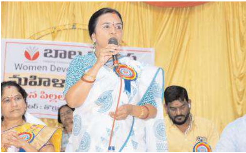
వికాస పిల్లల జన్మదిన వేడుకలకు