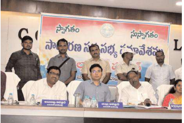
అందుబాటులో ఉంది వ్యవసాయ పరికరాలను పరికరాలు అందించాలని తెలిపారు.. భూపాలపల్లి పట్టణంలో ట్రాఫిక్ ను దృష్టిలో ఉంచుకొని నేషనల్

బోర్డును,హ్యాండ్ పంపుల మరమ్మత్తులకు, నూతన పైపు లైన్ ల నిర్మాణం, పైపు లైన్ ల రిపేర్ కు అంచనాలను తయారుచేసి, మండలాల వారీగా హ్యాండ్ పంపు రిపేర్ మెకానిక్ లను నియమించాలని కావలసిన స్పేర్ పార్ట్స్ ను కోసుగోలు చేసి ప్రజలకు అందుబాటులోకి తేవాలని అన్నారు. గత సంవత్సరం వరాల కారణంగా వరదలు సంభవించి భూపాలపల్లి నియోజకవర్గంలో పెద్ద మొత్తంలో చెరువులు కుంటులు తెగిపోవడం తో రైతులు రెండు పంటలు నష్టపోయారని వానాకాలం పంటకు చెరువులను అందుబాటులోకి తేవాలని లక్ష్యంతో ప్రభుత్వం ఏర్పడిన వెంటనే 78 చెరువుల మరమ్మత్తులకు నిధులు మంజూరు చేయించి మిగిలిన చెరువుల అంచనాలను తయారుచేసి ముఖ్యమంత్రి రేవంత్ రెడ్డికి అందించడం జరిగిందన్నారు. టెండర్లు పూర్తయిన చెరువుల మరమ్మత్తు పనులను ఇరిగేషన్ శాఖ అధికారులు ప్రతి 15 రోజులకు ఒకసారి సమీక్షించి వానాకాలం పంటకు రైతులకు అందుబాటులోకి తేవాలన్నారు వ్యవసాయ శాఖ అధికారులు రైతులకు లభించే నబ్బీడీల వివరాలను రైతులకు తెలియపరుస్తూ ఎరువులను