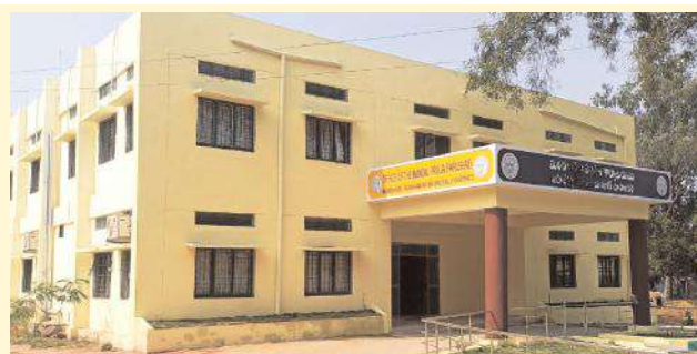
నూతన మండల పరిషత్ కార్యాలయ ప్రారంభోత్సవానికి మండల అధికారులు రాజకీయ నాయకులు, ప్రజా ప్రతినిధులు, పాల్గొనాలని వారు తెలిపారు.

మహాదేవపూర్. ఫిబ్రవరి 2, మేజర్ న్యూస్ సూర్య: మహాదేవపూర్ మండల ప్రజా పరిషత్ నూతన భవనం ను 4తేదీ నాడు తెలంగాణా ఐటి పరిశ్రమ ల శాఖ మంత్రి దుద్దిళ్ళ శ్రీధర్ బాబు ప్రారంభించనున్నట్లు ఎంపీపీ రాణిభాయి ఎంపీడిఓ రవీంద్రనాథ్ లు తెలిపారు, మండల కేంద్రంలోని ప్రభుత్వ సముదాయల ప్రాంగణంలో నూతన మండల పరిషత్ కార్యాలయం కొరకు అప్పటి ప్రభుత్వం ఒక కోటి రూపాయల నిధులు మంజూరు చేసి పనులు ప్రారంభించారు. నిధులసరిపోకపోవడంతో మండల సాధారణ నిధులనుండి 20లక్షల నిధులు మంజూరు చేసి మండల పరిషత్ కార్యాలయం పనులు పూర్తి చేశారు,