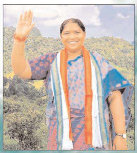
రాష్ట్ర పంచాయతీరాజ్ గ్రామీణ సీటి సరఫరా, స్త్రీ శిశు సంక్షేమ శాఖా మంత్రి దనసరి సీతక్క