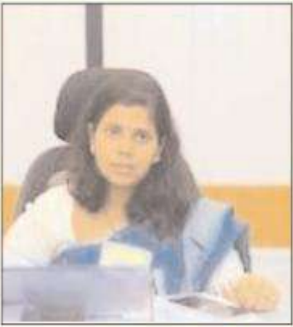
ఇలా త్రిపాతి (ఐపిఎస్) కలెక్టర్ ములుగు జిల్లా