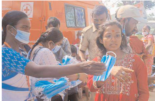
15లక్షల మాస్కులను సెంట్రల్ మెడిసిన్ స్టోక్స్ ద్వారా జాతర వినియోగం కోసం అందిస్తున్నారు.