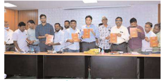
కలెక్టర్, ఎస్పీల చేతులమీదుగా టీయూడబ్ల్యూజే (ఐజేయు) డైరీ ఆవిష్కరణ