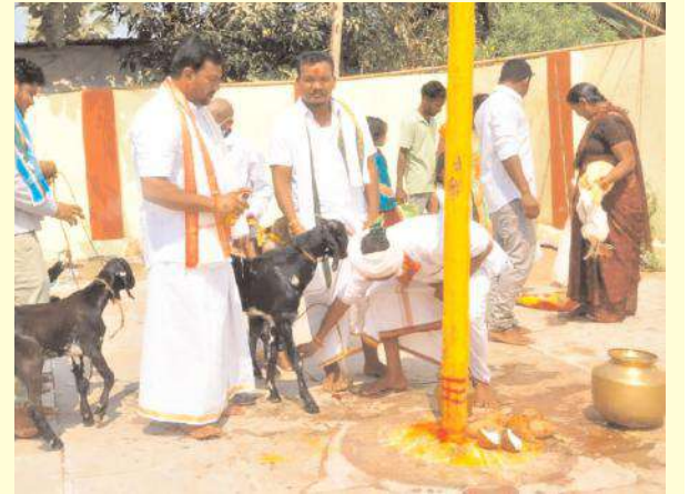
చెల్లించుకోవడానికి పోటీ పడటం