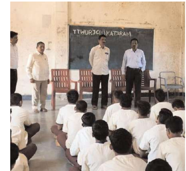
పది, ఇంటర్లో 100 శాతం