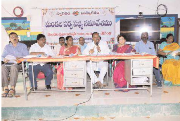
కార్యక్రమంలో జిడ్పీ సీఈవో విజయలక్ష్మి, డిపిఓ ఆశలత, తాసిల్దార్ సత్యనారాయణ స్వామి, ఎంపీపీవో సురేందర్, వివిధ శాఖల అధికారులు, ఎంపిటిసిలు, సర్పంచులు, తదితరులు పాల్గొన్నారు.

విధుల పట్ల అధికారులు నిర్లక్ష్యం వహిస్తే చర్యలు తప్పవు ఎమ్మెల్యే గండ్ర సత్యనారాయణ రావు రేగోండ్ ఫిబ్రవరి 04 మేజర్ న్యూస్ సూర్య: రాజోయే వేసవికి గ్రామాల్లో త్రాగునీటి సమస్యలు రాకుండా అధికారులు చూడాలని భూపాలపల్లి ఎమ్మెల్యే గండ్ర సత్యనారాయణ రావు అన్నారు. ఆదివారం మండల కేంద్రంలోని రైతు వేదికలో ఎంపీపీ వున్నం లక్ష్మి అధ్యక్షతన మండల సర్వసభ్య సమావేశం జరిగింది. ఈ కార్యక్రమానికి ఎమ్మెల్యే గండ్ర సత్యనారాయణరావు హాజరై మాట్లాడారు. విధుల్లో అధికారులు అలసత్వం వహిస్తే తప్పక చట్టపరమైన చర్యలు తీసుకుంటామని హెచ్చరించారు. అలాగే రాజోయే వేసవి కి గ్రామాల్లో నీటి సమస్యలు రాకుండా చూడాలని, కొత్తగా నియమితులైన ప్రత్యేక అధికారులు గ్రామాల్లోని సమస్యలను గుర్తించి వాటి పరిష్కారానికి చర్యలు చేపట్టాలని అన్నారు. సమావేశానికి హాజరు కాని అధికారులపై తీర్మానం చేసి చర్యలు చేపడతామని హెచ్చరించారు. త్వరలోనే ఆరు గ్యారంటీ పథకాలు అమలువుతాయని ప్రజలవరం ఆదర్శ పడద్దని భరోసా ఇచ్చారు. అనంతరం పదవి కాలం ముగిసిన సర్పంచ్ అకు ఎమ్మెల్యే సన్మానం చేశారు. ఈ