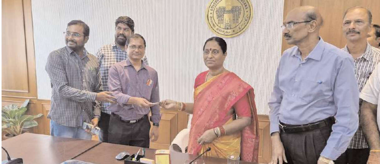
అన్లైన్ సేవలను ప్రారంభించిన మంత్రి కొండా సురేఖ

మీసేవ, పోస్టాఫీసులు, టీయాప్ ఫోలియో ద్వారా బుకింగ్ కు వాన్స్