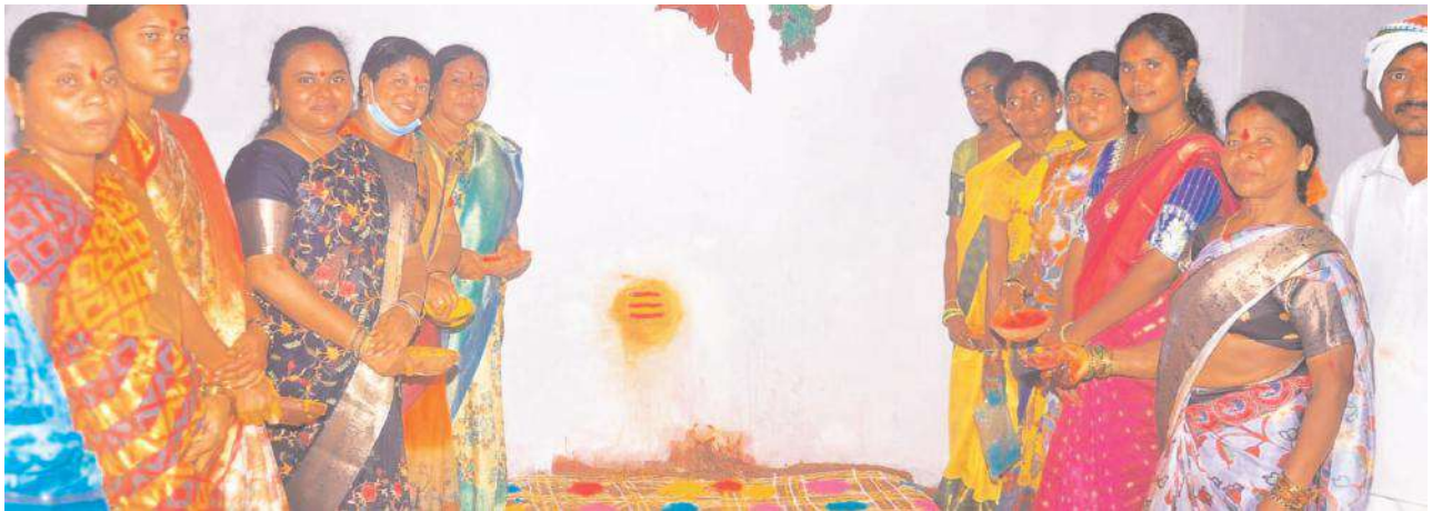
అంగరంగ వైభవంగా గుడి మేలిగే పండుగ