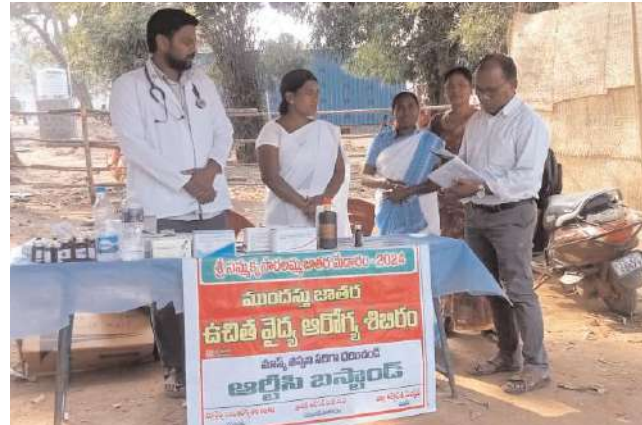
రొయ్యూరు వెంకటాపూర్ ములుగు వైద్య సిబ్బంది తదితరులు పాల్గొన్నారు.