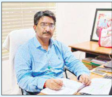
ఉచితంగా ప్రయాణం చేయవచ్చునా. విద్యార్థులు నకాలలో పరీక్ష కేంద్రాలకు చేరుకుని పరీక్షలో ఉత్తమ ప్రతిభ కనబరచి ఉత్తీర్ణులు కావాలని ఆయన ఆకాంక్షించారు.