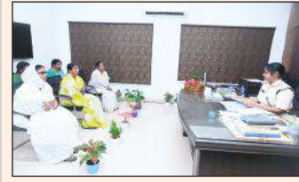
ఆదేశాలు ఇచ్చారు. ఈ సందర్భంగా ఎస్పి సోపల్ మీడియా మాధ్యమాలలో అపరిచితులు వంపి మేనేజ్మెంట్, లింకులు ఓపెన్ చేయవద్దని సూచించారు. ఓటిసీ సంబంధం తెలవ వద్దన్నారు.