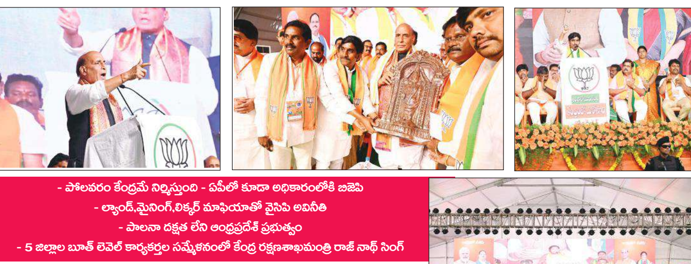
- పోలవరం కేంద్రమే నిర్మిస్తుంది - ఏసీఐ కూడా అధికారంలోకి బిజెపి