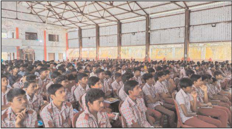
మున్సిపల్ కమిషనర్ మరియు సిబ్బంది సహకారంతో సమన్వయంతో నిర్వహించడం జరిగింది. విద్యార్థులు ఈ