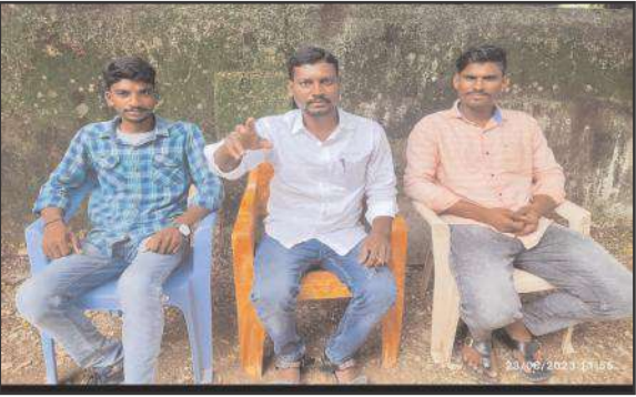
ఆదిలాబాద్ ఫిబ్రవరి 29 సూర్య మేజర్ న్యూస్

- విద్యార్థుల జీవితాలతో చెలగాటం కుదరదు - విద్యార్థి యువజన సంఘాల జేపీసీ అధ్యక్షులు మెస్రం భాస్కర్