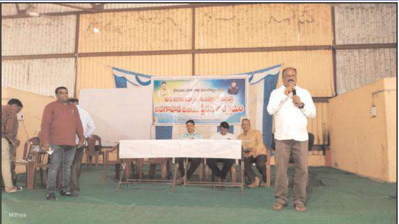
వారి సిబ్బంది, అవకాశాన్ని వినియోగించుకుని అత్యుత్తమ ఫలితాలు

పరీక్షలనేవి మనల్ని భయపెట్టడానికి కాదని, మన నైపుణ్యాన్ని ప్రదర్శించే వేదికలని, ఎలాంటి ఒత్తిడి, భయానికి గురికాకుండా పదవ తరగతి పరీక్షలు రాయాలని తెలిపారు. బెల్లంపల్లి లోని సింగరేణి ఫంక్షన్ హాల్లో మండలంలోని ప్రభుత్వ పాఠశాలల్లో చదువుతున్న పదవ తరగతి విద్యార్థులకు నిర్వహించిన రాసున్న పదవ తరగతి పరీక్షల పట్ల అవగాహన మరియు ప్రేరణ కార్యక్రమానికి ముఖ్యఅతిథిగా హాజరై వారు ప్రసంగించారు. ఇలాంటి స్ఫూర్తిదాయకమైన కార్యక్రమం ప్రతి మండలంలో నిర్వహించడం జరుగుతుందని, ఈ కార్యక్రమం సజ్జెక్ట్ ఎక్స్ ప్లైన్ తోను, మండల అభివృద్ధి అధికారి మరియు