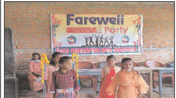
భైంసా, మార్చి 12, సూర్య మేజర్ న్యూస్