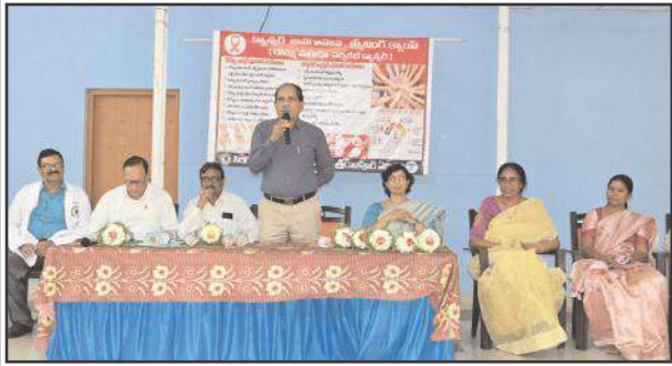
శ్రీరాంపూర్, మార్చి 12, సూర్య మేజర్ న్యూస్: