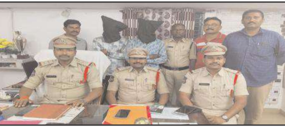
మందమర్రి టౌన్, మార్చి 22, సూర్య మేజర్ న్యూస్.