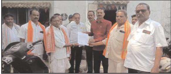
కాగజ్ నగర్, మార్చి 22, సూర్య మేజర్ న్యూస్