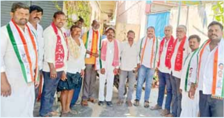
కాంగ్రెస్ శ్రేణుల్లో నూతన ఉత్సాహం నింపిన