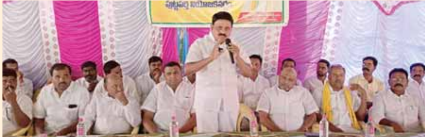
నాయకులు కార్యకర్తలను ఉద్దేశించి మాట్లాడుతున్న మాజీ మంత్రి