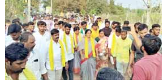
నూరు. తెలుగుదేశం పార్టీ నాయకులను ఇబ్బంది పెట్టిన ఏ ఒక్కరిని వదిలే ప్రసక్తి ఉండదని ఆమె స్పష్టం చేశారు...