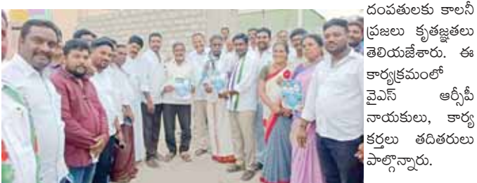
దంపతులకు కాలనీ ప్రజలు కృతజ్ఞతలు తెలియజేశారు. ఈ కార్యక్రమంలో వైఎస్ ఆర్స్పీ నాయకులు, కార్యకర్తలు తదితరులు పాల్గొన్నారు.