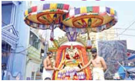
కదిరి, మేజర్ స్వ్యాస్ :

బ్రహ్మోత్సవాలలో భాగంగా ఖాద్రి లక్ష్మి నరసింహ స్వామి మంగళవారం ఉదయం శ్రీవారు సూర్యప్రభ వాహనంపై తిరువీధుల్లో భక్తులకు కనువిందు చేశారు. యాగశాలలో నిత్య కైంకర్యాలు నిర్వహించిన అనంతరం సూర్యప్రభ వాహనంపై శ్రీవారు ఆశీస్సులై