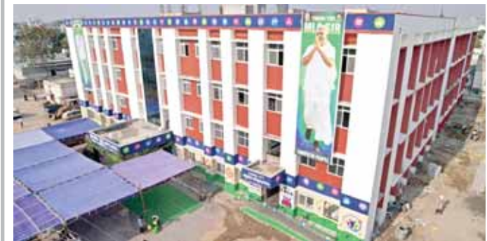
తాడిపత్రి పట్టణ ప్రజల ఆకాంక్ష నెరవేరింది - ఎమ్మెల్యే కేతిరెడ్డి పెద్దారెడ్డి