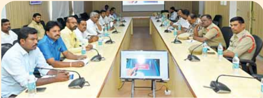
అవగాహన కార్యక్రమంలో పాల్గొన్న అధికారులు, రాజకీయ పార్టీల ప్రతినిధులు

పుట్టపర్తి మేజర్ న్యూస్: ఎన్నికల ప్రవర్తన నియమావళిపై పూర్తి స్థాయిలో అవగాహన ఉండా లని డిఆర్ఓ కొందర్యు పేర్కొన్నారు. బుధవారం కలెక్టర్ కార్యాలయంలో సాధారణ ఎన్నికలు - 2024 పై గుర్తింపు పొందిన రాజకీయ పార్టీల ప్రతినిధులకు నిర్వహించిన శిక్షణా కార్యక్రమంలో డిఆర్ఓ కొం డర్యు మాట్లాడుతూ ఎన్నికల పెడ్యూల్ విడుదల కాగానే ఎన్నికల ప్రవర్తన నియమావళి అమలులోకి వస్తుందని, రాజకీయ పార్టీలు, అభ్యర్థులు ప్రవర్తన నియమావళి పరిధిలోకి వస్తార న్నారు. ఎన్నికల కమిషన్ ఎప్పటికప్పుడు సూచనలు ఇవ్వడం జరుగుతోందని, వాటిని గుర్తింపు పొందిన రాజకీయ పార్టీల ప్రతినిధులకు తెలియజేయడం జరుగుతుం దని, సూచనలపై అవగాహన ఉండడం ఎంతో కీలకమన్నారు. ఏదైనా సందేహాలు ఉన్నా తమ దృష్టికి తీసుకువచ్చి నివృత్తి చేసుకోవాలన్నారు. రాజ కీయ పార్టీలు, అభ్యర్థులకు ఎన్నికల్లో ఏం చేయాలి.. ఏం చేయకూడదు అన్న అంశాలపై పూర్తి స్పష్టత ఉండాలని, ఎన్నికల ప్రవర్తన నియమావళిని ఎట్టి పరిస్థితుల్లోనూ ఉల్లంఘించరాదన్నారు. ఎన్నిక ల్లో నామినేషన్ ప్రక్రియ చాలా ముఖ్యమైనదని, వీలైనం తవరకు ముందుగానే నామినేషన్ వేసుకు నేలా