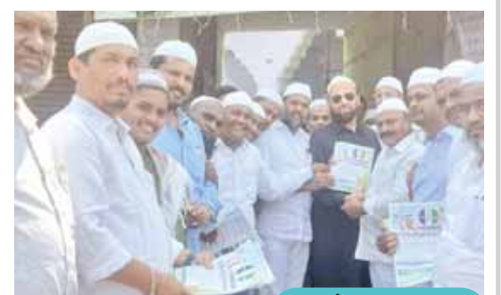
నగర మేయర్ మొహమ్మద్ వసీం సలీం