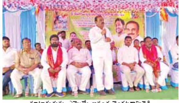
మాట్లాడుతున్న ఎమ్మెల్యే అనంత వెంకటరామిరెడ్డి