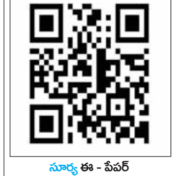
సూర్య ఈ - పేపర్