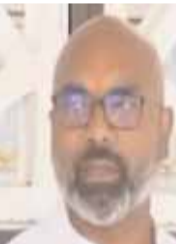
దజనంపై సీఎం సీట్లు గెలుస్తాయి