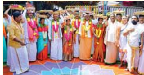
శ్రీకాళహస్తీశ్వర స్వామి దేవస్థానం స్వామి అమ్మవార్లకు పట్టువస్త్రాలు సమర్పణ

శ్రీకాళహస్తీ, మేజర్ న్యూస్: శ్రీకాళహస్తీశ్వర స్వామి దేవస్థానం మహాశివరాత్రి బ్రహ్మోత్సవాల్లో భాగంగా ఆదివారం శ్రీశైలం తరపున శ్రీ జ్ఞాన ప్రసానాంబ సమేత శ్రీకాళహస్తీశ్వర స్వామి వారికి కల్యాణోత్సవం నకు పట్టు వస్త్రాలు సమర్పించారు, చిత్తూరు జిల్లా కాణిపాక వరసిద్ధ వినాయక స్వామి