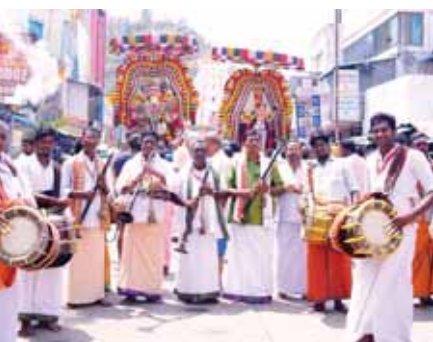
శివపార్వతుల ఊరేగింపు దృశ్యం

శ్రీకాళహస్తీ మేజర్ న్యూస్. శ్రీకాళహస్తీశ్వరని ఆలయంలో నిర్వహిస్తున్న వార్షిక బ్రహ్మోత్సవాలలో భాగంగా సోమవారం రాత్రి శివారాత్రి కళ్యాణం నిర్వహించనున్నారు. సభా పతిగా పిలిచే నటరాజ స్వామికి శివ కామి సుందరితో కళ్యాణం నిర్వహిస్తారు. ఆలయం లోని పడహారు కాళ్ళ మండపం లో వీరి వివాహం జరిపిస్తారు. సభా పతి వివాహం జరిగే రాత్రి ని ఆనంద రాత్రిగా పిలుస్తారు.