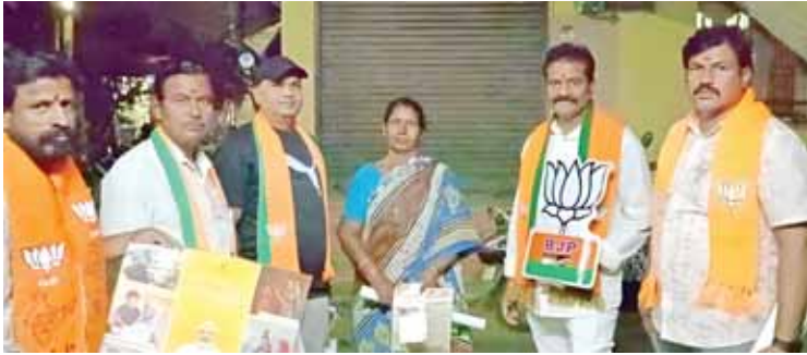
ఎన్నికల ప్రచారంలో బిజెపి నాయకులు