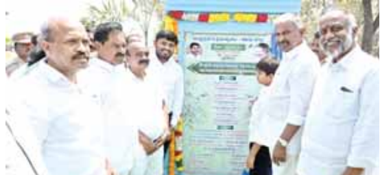
పార్కును ప్రారంభిస్తున్న మంత్రి పెద్దిరెడ్డి రామచంద్రారెడ్డి

చిత్తూరు అర్బన్ మేజర్ న్యూస్: చిత్తూరు అర్బన్ మేజర్ న్యూస్. పట్టణ ప్రాంత ప్రజల ఆరోగ్యాన్ని దృష్టిలో పెట్టుకుని దగ్గరగా ఉన్న