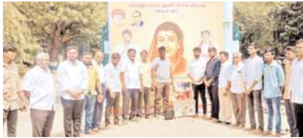
మాట్లాడుతున్న బీజే జేపీసీ ఫోరం నేతలు

తిరుపతి ఎడ్యుకేషన్, మేజర్స్ న్యూస్ : ఆధ్యాత్మిక పుణ్యక్షేత్రంగా విరాజిల్లుతున్న విశ్వవిద్యాలయాలు కొలువై విద్యా క్షేత్రంగా ఏడు విశ్వవిద్యాలయాలతో దేశంలోనే రెండోవ మహిళా విశ్వవిద్యాలయం కలిగిన తిరుపతి నగరంలో చదువుల తల్లి, తొలి మహిళా ఉపాధ్యాయురాలు, సామాజిక విప్లవకారిని సావిత్రిబాయి పూలే విగ్రహాన్ని తిరుపతిలో ఏర్పాటు చేయాలని ఆంధ్రప్రదేశ్ బీజే జేపీసీ ఫోరం నేతలు డిమాండ్ చేశారు. సావిత్రి బాయి పూలే 127వ వర్షాంతి సందర్భంగా ఆదివారం ఎస్వియూ ప్రధాన ద్వారం వద్ద సావిత్రిబాయి పూలే