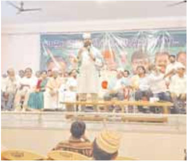
మాట్లాడుతున్న మైనార్టీ నాయకులు