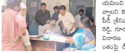
విచారణ చేస్తున్న అధికారులు