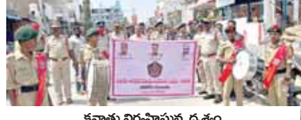
కవాతు నిర్వహిస్తున్న దృశ్యం