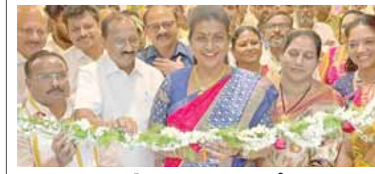
హెటల్స్ ను ప్రారంభిస్తున్న మంత్రి రోజా

తిరుమల, మేజర్ న్యూస్: సామాన్య భక్తులను దృష్టిలో ఉంచుకొని తక్కువ ధరకే నాణ్యమైన ఆహారం అందించే విధంగా ఏపీ టూరిజం అధ్వర్యంలో మూడు కొత్త రెస్టారెంట్లను అందుబాటులోకి తీసుకొచ్చారు. తిరుమలలో మూడు ప్రాంతాల్లో పర్యాటక శాఖామంత్రి రోజా టూరిజం హెటల్స్ ను రోజా ప్రారంభించారు. రిజర్వ్ కట్ చేసి రెస్టారెంట్లో ఆల్కహాల్ ను స్వీకరించారు. అనంతరం మీడియాతో మాట్లాడుతూ స్టార్ హెటల్ స్థాయిలో రూపురేఖలు మార్చి తిరుమలలోని అన్నమయ్య భవన్, బాలాజీ, నారాయణగిరి టూరిజం హెటల్స్ ను భక్తులకు అందుబాటులో తెచ్చామన్నారు. తక్కువ ధరకే నాణ్యమైన ఆహారాన్ని భక్తులకు అందిస్తామని తెలిపారు. బోర్డు నిర్ణయించిన ధరలకే విక్రయాలు చేయనున్నామని తెలిపారు. తక్కువ ధరకే హెటల్స్ ను ఏపీ టూరిజంకు లీజుకు ఇచ్చిన టీడీపీకి ధన్యవాదాలు తెలిపారు.