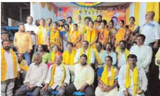
పార్టీలోకి చేరిన కార్యకర్తలతో పులివర్తి నాసి