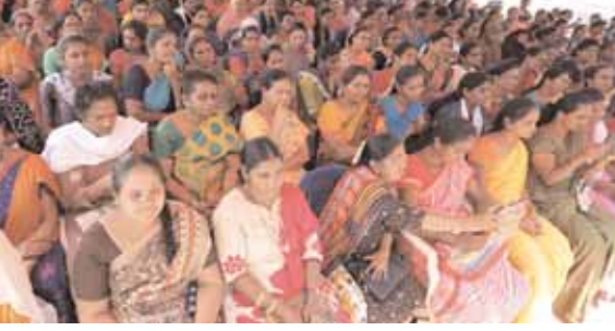
కార్యక్రమంలో పాల్గొన్న మహిళలు