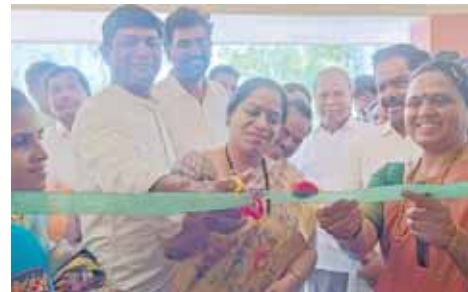
ఉప ముఖ్యమంత్రి నారాయణస్వామి