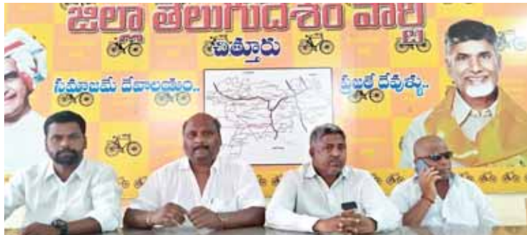
సమావేశంలో మాట్లాడుతున్న తెలుగుదేశం పార్టీ నాయకులు