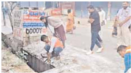
పాలిశుద్ధ్య పనులను తనిఖీ చేస్తున్న కమిషనర్