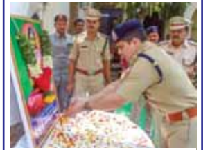
నివాళులు అర్పిస్తున్న ఎస్సీ పటేల్