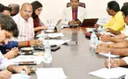
అధికారులతో మాట్లాడుతున్న కలెక్టర్ లక్ష్మీశ

రానున్న సార్వత్రిక ఎన్నికలు 2024 కు సంబంధించి వివిధ రాజకీయ పార్టీలు ఎన్నికల ప్రవర్తనా నియమావళిని తప్పక అనుసరించాలి అని, ఎన్నికల సన్నద్ధతపై అన్ని ఏర్పాట్లు చేపడుతున్నారని కలెక్టర్ జిల్లా ఎన్నికల అధికారి డా.జి.లక్ష్మీశ పేర్కొన్నారు. బుధవారం ఉదయం స్థానిక జిల్లా కలెక్టరేట్ లోని మినీ సమావేశ మందిరం నందు కలెక్టర్ ఆధ్వర్యంలో క్లెయిమ్స్ అండ్ అప్లైడ్స్, ఎన్నికల సన్నద్ధత పై గుర్తింపు పొందిన రాజకీయ పార్టీ నాయకులతో సమీక్ష సమావేశం నిర్వహించారు