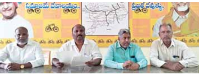
విలేకరుల సమావేశంలో మాట్లాడుతున్న టీడీపీ నాయకులు