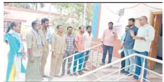
అధికారులు, పంచాయతీ కార్యకులు పాల్గొన్నారు.