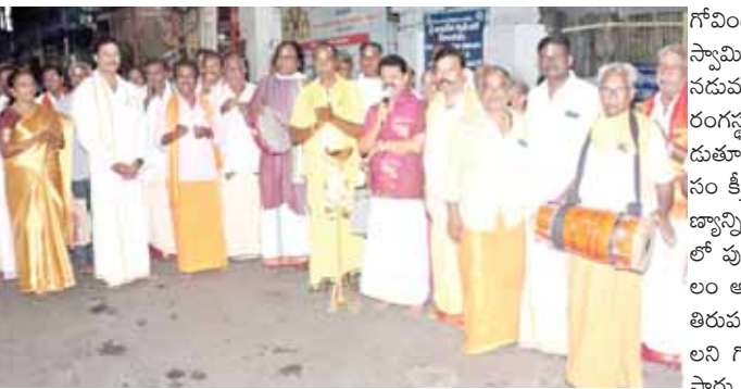
రంగస్థలి కళాకారులు సంకీర్తన చేస్తున్న దృశ్యం

తిరుపతి ఎడ్యుకేషన్, మేజర్‌న్యూస్: ఆధ్యాత్మిక నగరమైన తిరుపతిలో అడుగుడుగునా భక్తిభావనాతో నిత్య గోవిందా నామ స్మరణ వినిపిస్తుంది. రాయలసీమ రంగస్థలి కళాకారులు ప్రతి శనివారం నగర సంకీర్తన చేయాలని సంకల్పించారు. ఈ క్రమంలో శనివారం వేకువజామున స్నానమాచరించి గోవింద నామాలు ధరించి