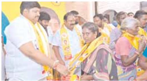
పార్టీ కండువా కప్పి పార్టీలోకి ఆహ్వానిస్తున్న గురజాల

టీడీపీ కండువా కప్పుకున్న వైకాపా కార్యకర్త