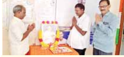
నివాసులు అర్చిస్తున్న దృశ్యం

ఎంపీటీసీ కార్యాలయంలో పాట్లీ శ్రీరాములు జయంతి