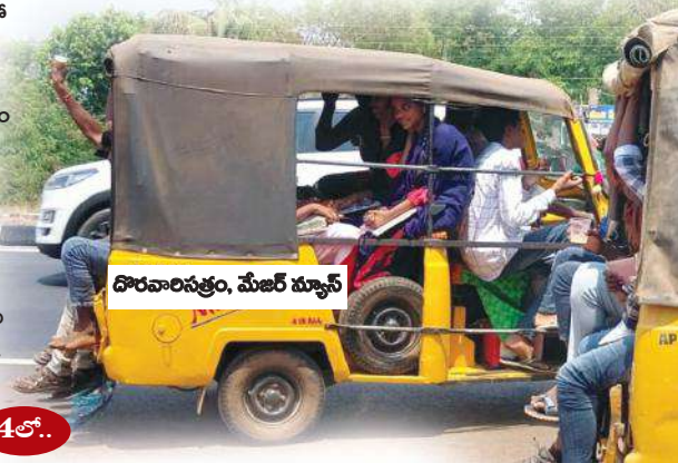
దొరవారిసత్రం, మేజర్ న్యూస్

బస్సులు లేక ఆటోల్లో ప్రయాణం... ఆందోళనలో విద్యార్థుల తల్లిదండ్రులు... పట్టణం నుండి అధికారులు