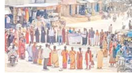
అవగాహన కల్పిస్తున్న అధికారులు