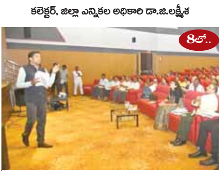
కలెక్టర్, జిల్లా ఎన్నికల అధికారి డా.జి.లక్ష్మీశ