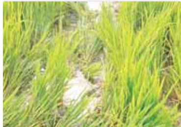
నాశనమైన వరి పంట