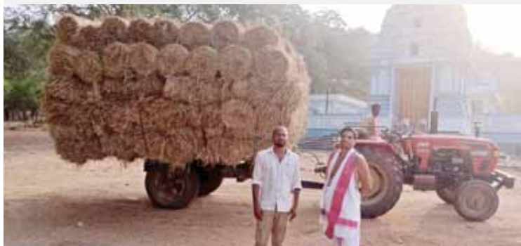
వెంకన్న గోవులకు దాతల దాతృత్వంతో పరిగడ్డి పంపిణీ చేసిన దృశ్యం