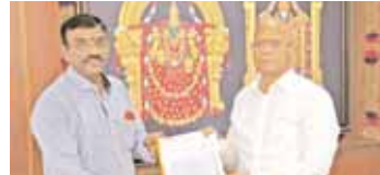
విరాళాన్ని అందచేస్తున్న దృశ్యం