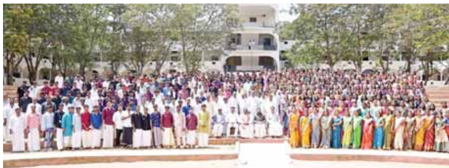
కార్యక్రమంలో పాల్గొన్న విద్యార్థి విద్యార్థులు