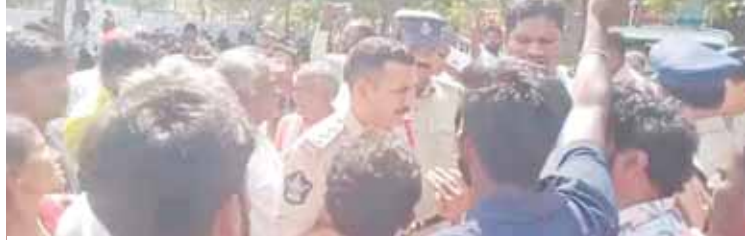
ఒకటవ పట్టణ పోలీస్ స్టేషన్ వద్ద నిరసన తెలుపుతున్న మృతిని కుటుంబ సభ్యులు, బంధువులు గ్రామస్థులు