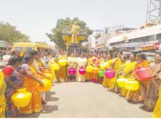
ఖాళీబిందెలతో నిరసన తెలపుతున్న మహిళలు