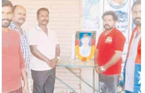
భగత్ సింగ్ కు నివాళులు అర్పిస్తున్న దృశ్యం