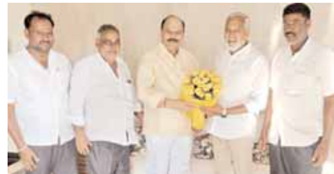
పులివర్తినానికి పుష్పగుచ్ఛం అందచేస్తున్న సైకం

టిడిపి గెలుపుకు సహకరించాలని నాని వింతి టిడిపి గెలుపు ఖాయమన్న సైకం