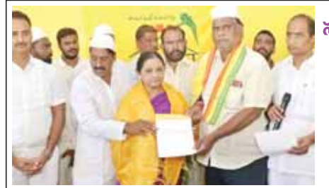
ధృవీకరణ పత్రాన్ని అందచేస్తున్న టిడిపీ నాయకులు