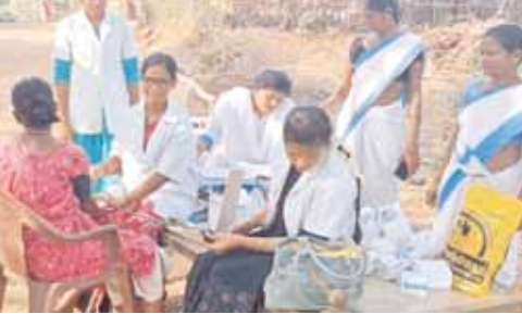
పరీక్షలు నిర్వహిస్తున్న వైద్యాధికారులు