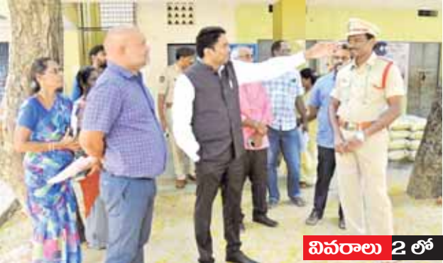
వివరాలు అడిగి తెలుసుకుంటున్న కలెక్టర్