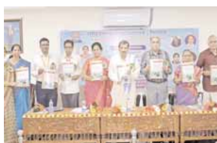
శ్రోతర్లను విడుదల చేస్తున్న దృశ్యం