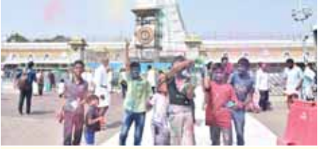
తిరుమలలో హెాలీ వేడుకల్లో పాల్గొన్న చిన్నారులు

తిరుమల, మేజర్ న్యూస్: ప్రతి ఏడాది ఫాల్గుణ శుద్ధ పౌర్ణమి రోజు హెాలీ పండుగను జరుపుకుంటారు. హెాలీ పండుగను హెాలికా పూర్ణిమ అని కూడా పిలుస్తారు. రంగుల పండుగ అయితే హెాలీ అంటే.. అందరికీ ఇష్టమే. అన్ని వర్గాల వారు ఈ పండుగ జరుపుకుంటారు. చిన్న, పెద్దా తేడా లేకుండా... అంతా కలిసి హెాలీ సంబరాలలో మునిగిపోతారు. తిరుమలలో ఎక్కడ చూసినా హెాలీ సంబరాలే కనిపిస్తున్నాయి. ఉదయం నుంచే రంగులతో వీధుల్లోకి వచ్చేవారు ప్రజలు. స్నేహితులు, బంధువులపై రంగులు చల్లుకుంటూ... తెగ ఎంజాయ్ చేస్తున్నారు. రాజకీయ నేతలు కూడా తామేమీ తక్కువ కాదంటూ హెాలీ సంబరాలలో పాలుపంచుకుంటున్నారు. రంగుల్లో మునిగి తేలుతున్నారు.