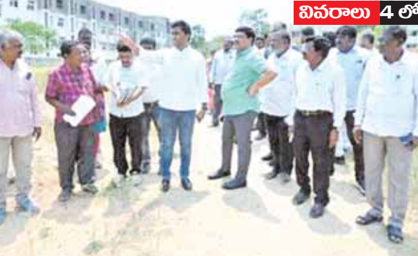
అధికారులకు సూచనలిస్తున్న కలెక్టర్