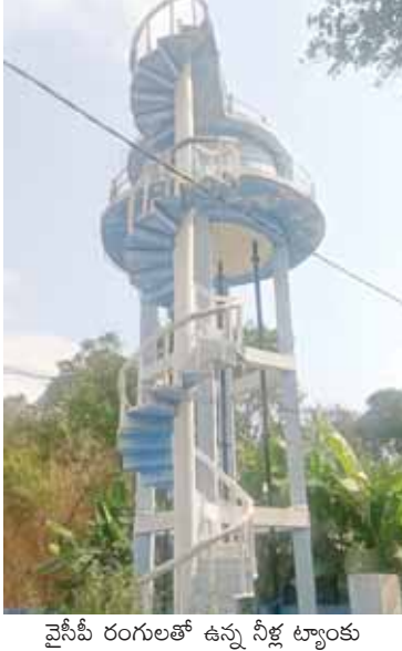
వైసీపీ రంగులతో ఉన్న నీళ్ల ట్యాంకు