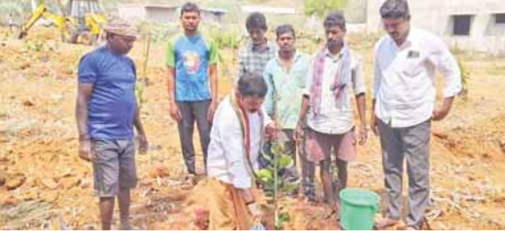
తిరుపతి బెల్ల చెట్టు నాటుతున్న దేవస్థానం చైర్మన్