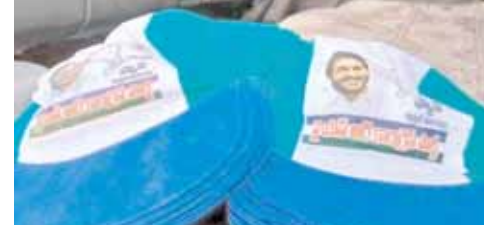
బ్యాగులను ఏర్పాటు చేసిన వైసిపి నాయకులు

వైఎస్ఆర్ఎఫ్ ఎన్నికల ప్రచార సామాగ్రి, లారీని, స్వాధీనం చేసుకున్న ఎన్నికల ఛోయింగ్ సోడ్ అధికారులు. రేణిగుంట ప్రైవేట్ గిడ్డంగి వద్ద వైసిపి ఎన్నికల ప్రచార సామాగ్రి ఉంచారని అధికారులకు రాబడిన సంవత్సరం మేరకు మంగళవారం మధ్యాహ్నం ఎన్నికల ఛోయింగ్ సోడ్ అధికారి స్థానిక పోలీసులు సహాయంతో తనిఖీలు చేపట్టారు. ఈ తనిఖీలలో వైఎస్ఆర్ఎఫ్ ప్రచారానికి సంబంధించిన క్యాప్ లు, బనియన్ లు పలు సామాగ్రిని స్వాధీనం చేసుకున్నారు. ఈ నేపథ్యంలో అధికారులు గుర్తించడం లారీ డ్రైవర్ పరారీ అయ్యారు. అనంతరం అధికారులు ప్రచార సామాగ్రిని స్వాధీనం చేసుకుని సీజ్ చేశారు.