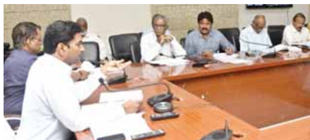
అధికారులకు సూచనలు ఇస్తున్న కలెక్టర్

మున్సిపాలిటీ, మండలాలలో చలివేంద్రాలు ఏర్పాటు మనుషులకే కాకుండా పశుపక్ష్యాదులకు కూడా త్రాగు నీటిని అందేలా చూడాలి ప్రతి 15 రోజులకు మున్సిపాలిటీ, మండలాలలో త్రాగునీటి నిర్వహణ సమావేశం నిర్వహించాలి ఎండాకాలంలో త్రాగు నీటి ఎద్దడి నివారణకు ప్రణాళికలు సిద్ధం చేసి ప్రజలకు ఎలాంటి ఇబ్బంది లేకుండా చర్యలు చేపట్టాలి తిరుపతి జిల్లా కలెక్టర్ డా.జి. లక్ష్మీశ