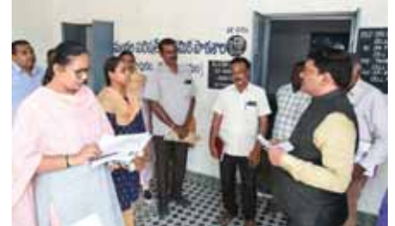
అధికారులకు సూచనలు ఇస్తున్న జేసీ

గుడిపాల, మేజర్ న్యూస్. గుడిపాల మండల పరిధిలోని పోలింగ్ కేంద్రాలలో అన్ని రకాల మౌలిక సదుపాయాలు కల్పించాలని జిల్లా జాయింట్ కలెక్టర్ మరియు 172 చిత్తూరు నియోజకవర్గం రిటర్నింగ్ అధికారి పి.శ్రీనివాసులు పేర్కొన్నారు. సార్వత్రిక ఎన్నికల 2024 లో భాగంగా మంగళవారం 172 చిత్తూరు నియోజకవర్గం పరిధిలోని గుడిపాల మండలంలో పలు పోలింగ్ కేంద్రాలు మరియు రాష్ట్ర సచివాలయ వద్ద ఏర్పాటు చేసిన చెక్క పోస్టును గుడిపాల మండల తహశీల్దార్ మరియు ఏ ఆర్ ఓ, విజయలక్ష్మి ఎంపీడివో రాజాశేఖర్ రెడ్డి లతో కలిసి రిటర్నింగ్ అధికారి పి.శ్రీనివాసులు పరిశీలించారు. గుడిపాల మండల పరిధిలో ఉన్న 45 పోలింగ్ కేంద్రాలలో అన్ని రకాల మౌలిక సదుపాయాలు ఉండే