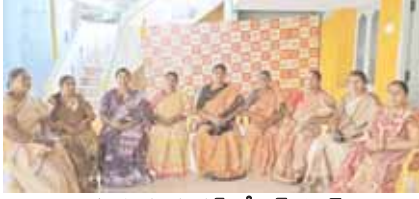
గూడూరు రూరల్. మేజర్ న్యూస్