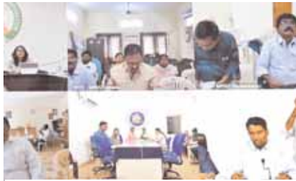
వీడియో కాన్ఫరెన్స్ లో పాల్గొన్న అధికారులు