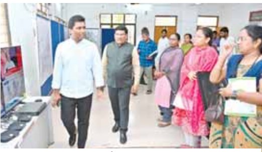
అధికారులతో మాట్లాడుతున్న కలెక్టర్

జిల్లా ఎన్నికల అధికారి, జిల్లా కలెక్టర్ ఎస్. షణ్మోహన్