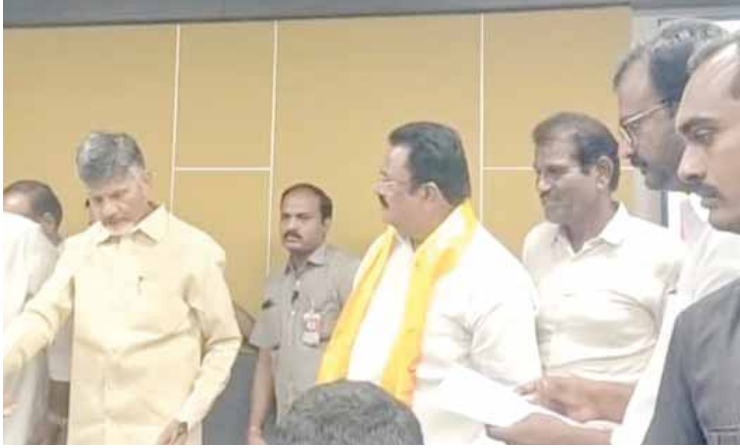
చంద్రబాబు నాయుడుతో శ్రీకాళహస్తి మాజీ ఎమ్మెల్యే ఎస్సీవి నాయుడు