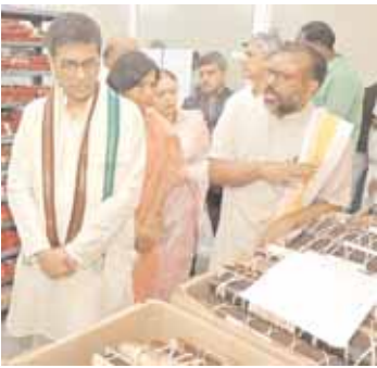
తాళపత్రాలను చూస్తున్న సుప్రీం కోర్టు ప్రధాన న్యాయ మూర్తి డాక్టర్ డివై చంద్రచూడ్