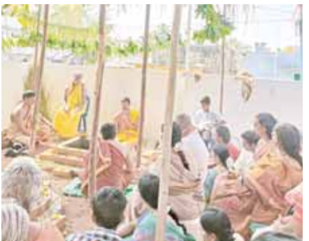
హోమం నిర్వహిస్తున్న దృశ్యం

మెదురుకుప్పం, మేజర్ న్యూస్: మండలంలోని నల్లవెంగనపల్లి పంచాయతీ తాటిమాకులపల్లి గ్రామంలో బుధవారం కుంభాభిషేక మహోత్సవం అత్యంత వైభవంగా జరిగింది. కంచి కామాకోటి పీఠాధిపతుల ఆశీర్వాదంతో గ్రామంలో నూతనంగా నిర్మించిన శ్రీ పరసిద్ధి వినాయక స్వామి, శ్రీ పల్లి దేవ సేనా సమేత శ్రీ సుబ్రహ్మణ్యేశ్వర స్వామి మరియు శ్రీ నాగాలమ్మ స్వామి, అమ్మవార్ల విగ్రహాలను ప్రతిష్ఠించడం జరిగింది. విగ్రహాలకు పూజాది కార్యక్రమాలు, హోమాలు, జపాలు నిర్వహించారు. భక్తులు అత్యంత భక్తి శ్రద్ధలతో పూజా కార్యక్రమంలో పాల్గొన్నారు. అనంతరం అర్చకుల మధ్య కుంభాభిషేక మహోత్సవం అత్యంత వైభవంగా జరిగింది.