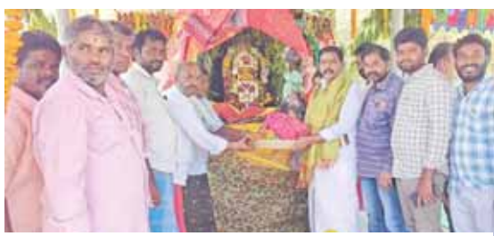
వెల్లంపాడు జాతరలో దేవస్థానం చైర్మన్