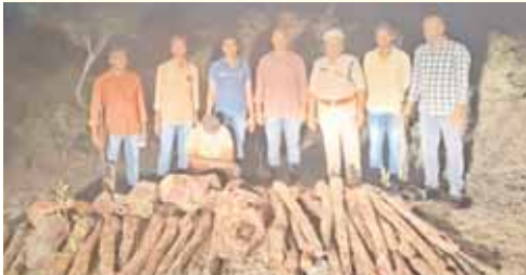
స్వాధీనం చేసుకున్న ఎర్రచందనం దుంగలు

51 ఎర్రచందనం దుంగలు స్వాధీనం పాటు ఒకరు అరెస్ట్