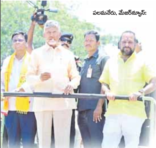
పలమనేరు, మేజర్ న్యూస్:

160 అసెంబ్లీ 24 పార్లమెంటు స్థానాలలో కూటమిని గెలిపించండి జగన్ రాయలసీమ ద్రోహి టీడీపీ అధినేత నారా చంద్రబాబు నాయుడు