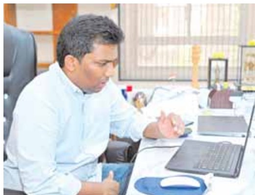
వీడియో కాన్ఫరెన్స్ ద్వారా అధికారులతో మాట్లాడుతున్న కలెక్టర్