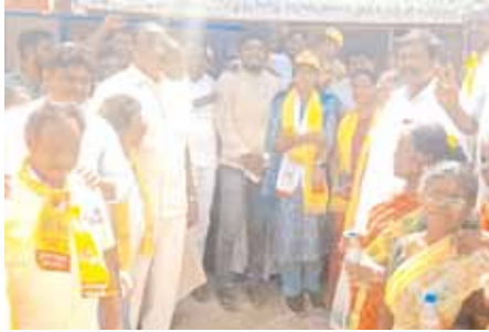
ప్రచారం నిర్వహిస్తున్న దృశ్యం

ముఖ్య అతిథులుగా పాల్గొన్న నెలవల, పరసా, ఉయ్యాల