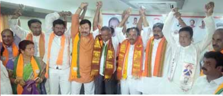
కార్యక్రమంలో పాల్గొన్న ఎంపీ, ఎమ్మెల్యే అభ్యర్థులతో పాటు పలు పార్టీల నాయకులు

తిరుపతి ఎడ్యుకేషన్ మేజర్ న్యూస్ దేశంలో అవినీతి లేని పార్టీ ఏదైనా ఉందంటే అది బజెపి మాత్రమేనని, నాయకత్వ లక్షణాలు లేని వ్యక్తి ఒక జగన్మోహన్ రెడ్డి అని, వైయస్ రాజశేఖర్ రెడ్డి నాయకత్వ లక్షణాలతో కూడిన పాలన అందించి ప్రజల మన్ననలు పొందితే ప్రస్తుతం ఆయన తనయుడు జగన్మోహన్ రెడ్డికి ఎటువంటి నాయకత్వ లక్షణాలు లేకుండా బడుగు బలహీన వర్గాలకు మొండి చెయ్యి చూపుతున్నారని, వైఎస్ఆర్పి జగన్ రెడ్డి ఒక్కడే నా ఆ పార్టీ కోసం కష్టపడిన మాకంతా వర్తించదా అని తిరుపతి