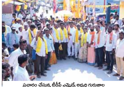
ప్రచారం చేస్తున్న టీడీపీ ఎమ్మెల్యే అభ్యర్థి గురుజాల