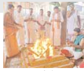
హోమాం నిర్వహిస్తున్న దృశ్యం

కుంటూ తమ కుటుంబాలకు గణపతి అనుగ్రహం కలుగుతుందని సంకట చవితిని పురస్కరించుకొని ఆలయంలో అంజి గణపతి ఆలయం వద్ద ప్రత్యేక పూజలు చేపట్టారు. ఆలయ అర్చకులు, వేదపండితుల ఆధ్వర్యంలో కలశ స్థాపన పూజలు నిర్వహించి, గణపతి హోమాన్ని శాస్త్రయుక్తంగా నిర్వహించారు. అనంతరం అంజి వినాయక స్వామి అభిషేకాన్ని నిర్వహించి, స్వామివారికి విశిష్ట అలంకారం చేశారు. ధూప దీప నైవేద్యాలు నివేదించి పూర్ణ హారతులు సమర్పించారు. ఈ గణపతి హోమా పూజాది కార్యక్రమంలో శ్రీకాళహస్తి