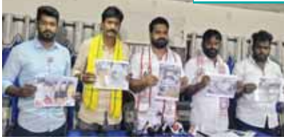
విలేకరులతో మాట్లాడుతున్న నాయకులు