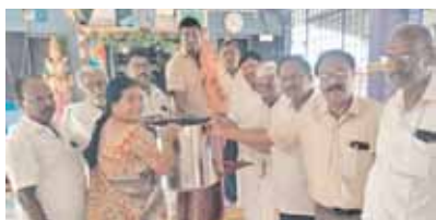
స్టీలు పాత్రను అందచేస్తున్న దృశ్యం

మెదురుకుప్పం, మేజర్ న్యూస్ : మండలంలోని చవట గుంటలో వెలసి ఉన్న శ్రీకృష్ణ ద్రావణ సమేత ధర్మాజుల ఆలయానికి భారతం మెట్లకు సంబంధించిన డీవర్ పరమాత్మ, నాగరాజమ్మ దంపతులు స్టీల్ పాత్రను వితరణగా అందజేశారు. శుక్రవారం ఆలయంలో ప్రత్యేక పూజా కార్యక్రమాలు నిర్వహించారు. అమ్మవారి దర్శించుకుని స్టీల్ పాత్రను ధర్మకర్త మండల కి అందజేశారు. స్టీలు పాత్ర వితరణ చేసిన దంపతులను ధర్మకర్త మండలి అభినందించారు.