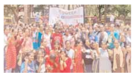
తమ ఓటు కార్డులను చూపుతున్న విద్యార్థులు