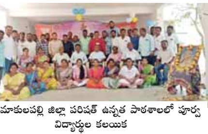
ఆరిమాకులపల్లి జిల్లా పరిషత్ ఉన్నత పాఠశాలలో పూర్వ విద్యార్థుల కలయిక

ఎన్ఆర్పురం, మేజర్ న్యూస్: 20 ఏళ్ల తర్వాత పూర్వ విద్యార్థులు అందరూ ఒక చోట కలవడం ఓ అద్భుతం పూర్వ విద్యార్థులు ఉపాధ్యాయులు అన్నారు. ఎన్ఆర్పురం మండలంలోని ఆరిమాకులపల్లి జిల్లా పరిషత్ ఉన్నత పాఠశాల లో 2003, 2004 సంవత్సరంలో వారు పదవతరగతి చదువుకున్న