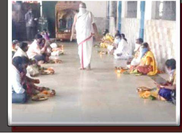
ఉమ్మడి గోదావరి జిల్లాల సూర్య బ్యూరో :