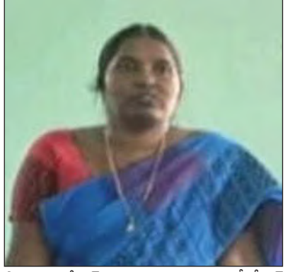
పొన్నూరు మేజర్ న్యూస్ : 2023-24 రబీ సీజన్ కుగాను పొన్నూరు నట్ డివిజన్ పరిధిలోని