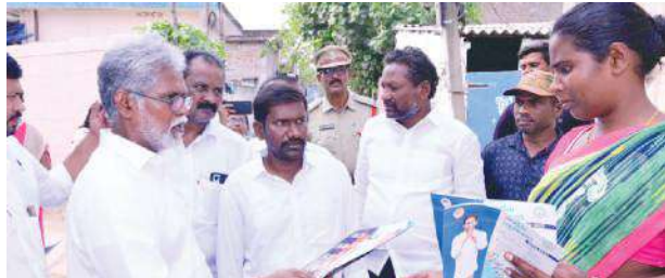
దుయ్యబట్లూరు . ఆ విధానానికి ముఖ్యమంత్రి జగన్ స్పష్టపలికి వాలంటీర్లను నియమించారన్నారు. ఎన్నికల ముందు ప్రజలకు ఏదైతే మాట ఇచ్చారో ఆ మాటకు కట్టుబడి సాహసోపేత నిర్ణయాలతో పాలన సాగిస్తున్నారని తెలియజేశారు. జగన్న పాలనకు, హామీల అమలకు ప్రజల నుంచి విశేష స్పందన లభిస్తుందని కొనియాడారు. ఏ ప్రభుత్వ పరిపాలన బాగుందో ప్రజలు ఆలోచించుకోవాలని, మంచి చేసే వారికే మద్దతు ఇవ్వాలని ఎమ్మెల్యే ప్రజలను కోరారు. ఈ కార్యక్రమంలో స్థానిక ప్రజాప్రతినిధులు, అధికారులు, వైయస్ఆర్ కాంగ్రెస్ పార్టీ నాయకులు, సచివాలయ సిబ్బంది, వాలంటీర్లు, తదితరులు పాల్గొన్నారు.

కంచికపర్ల మార్చి 14 మేజర్ స్టూస్ ప్రజా సంక్షేమమే జగన్న పాలనని నందిగామ శాసనసభ్యులు మొండితోక జగన్ మోహన్ రావు అన్నారు. గురువారం గడపగడపకు మన ప్రభుత్వం స్థానిక సచివాలయం 3 పరిధిలో నిర్వహించారు. ఉదయం ప్రతి ఇంటికీ వెళ్లి ప్రజలను కలిశారు. ప్రభుత్వం సుండి సంక్షేమ ఫలాలను అందించి లేనిది అడిగి తెలుసుకున్నారు. ఈ సందర్భంగా ఆయన మాట్లాడుతూ జగన్న పాలనలో అర్హత కలిగిన ప్రతి కుటుంబానికి రాజకీయాలకు, కుల, మతాలకు అతీతంగా పథకాలు అందుతున్నాయని తెలిపారు. ప్రభుత్వం నియమించిన వాలంటీర్ల ప్రతి ఇంటికీ వెళ్లి అర్హులను గుర్తించి పథకాలకు ఎంపిక చేస్తున్నారన్నారు. జగన్న నేరుగా బటన్ నొక్కి మహిళల బ్యాంకు ఖాతాల్లోనే సంక్షేమ పథకాల డబ్బులు జమ చేస్తున్నారని చెప్పారు. కానీ తెలుగుదేశం పార్టీ పాలనలో సంక్షేమ పథకాలు కావాలంటే టిడిపి నాయకుల ఇళ్ల చుట్టూ చెప్పలు అరిగేలా, నెలల పాటు తిరగాల్సి వచ్చేదని, వారి ఇళ్ల ముందు, కార్యాలయాల దగ్గర పడిగాపులు కాయాల్సిన పరిస్థితి ఉండేదని గుర్తు చేశారు. జన్మభూమి కమిటీల లంచాలు, దోపిడీల గురించి ప్రత్యేకంగా చెప్పాల్సిన అవసరం లేదని ఎద్దేవా చేశారు. ఏదైనా పథకానికి అర్హత పొందాలంటే ముందుగా జన్మభూమి కమిటీల సభ్యులైన తెలుగుదేశం పార్టీ వారికి లంచాలు ఇవ్వనిదే పని చేసేవారు కాదని