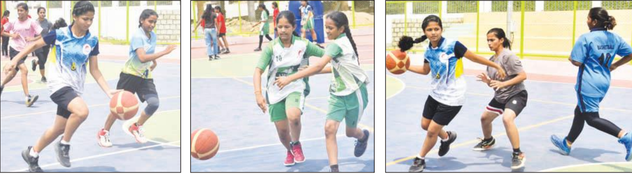
జిల్లా స్టాయి బాస్కెట్ బాల్ సెలక్షన్స్ కు వేదికగా అంకిరెడ్డిపాలెం ప్రాబుల్స్ ఎంపిక చేసిన సెలక్షన్లు

గుంటూరు జిల్లా నేటి దినపత్రిక సూర్య బ్యూరో : గ్రామ సమగ్రాభివృద్ధిలో భాగంగా క్రీడా హబ్ గా రూపొందించిన అంకిరెడ్డిపాలెం - బాస్కెట్ బాల్ జిల్లా స్టాయి క్రీడాకారుల ఎంపికకు చక్కని వేదికగా మారింది. ఉమ్మడి జిల్లా నలుమూలల నుంచి వచ్చిన జిల్లా జట్టులో చోటు దక్కించుకోవాలన్న పట్టుదలతో వచ్చిన క్రీడాకారుల పోటాపోటీ ప్రదర్శనలతో ఆదివారం ఉదయం నుంచి సాయంత్రం వరకు గ్రామం మొత్తం క్రీడా పండుగ వాతావరణం నెలకొంది. రాష్ట్రంలోనే అభివృద్ధికి కేరాఫ్ అడ్రస్ గా మారిన అంకిరెడ్డి పాలెంలో ఇటీవలే అత్యాధునిక వసతులతో కూడిన సింధటిక్ బాస్కెట్ బాల్ కోర్టు నిర్మించిన సంగతి అందరికీ తెలిసిందే. ఒక్క అంకిరెడ్డిపాలెం గ్రామానికి మాత్రమే కాక చుట్టుపక్కల గ్రామాల క్రీడాకారులకు ఉపయోగంగానూ.. విద్యార్థులు చదువుతో పాటు క్రీడల్లో కూడా రాణించాలన్న సమోస్తత సంగతి లుతోనూ.. దీన్ని రూపొందించడం జరిగింది చుట్టూ ఆహ్లాదకరమైన వాతావరణం, పచ్చని చెట్లతో హరితహారంలా మారిన సుందర ప్రదేశం నడుమ అన్ని రకాల వసతులతో నిర్మితమైన ఈ కోర్టు ప్రారంభోత్సవ కార్యక్రమానికి బాస్కెట్ బాల్ అసోసియేషన్ రాష్ట్ర, జిల్లా స్టాయి నాయకులు హాజరై రాష్ట్ర స్టాయి టోర్నమెంట్ లు జరుపుకునేందుకు ఇది అత్యంత అనువుగా ఉందని