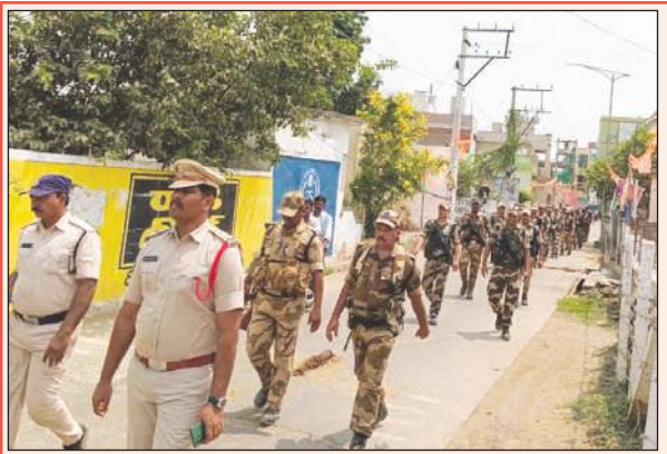
ప్రశాంతంగా ఎన్నికలు జరిగేలా చేస్తాం

మాట్లాడుతూ శనివారం నుండి ఎన్నికల కోడ్ వచ్చినందున ఎన్నికల విధుల్లో ఎంతో అప్రమత్తంగా ఉండాలని, విధులు కేటాయించబడిన అధికారులు, సిబ్బంది అందుబాటులో ఉండాలని స్పష్టం చేశారు. ఎన్నికల నిర్వహణలో కీలకమైన ఎన్నికల విభాగం సూపరిండెంట్ సెక్షన్ లో అందుబాటులో లేకపోవడం, గతంలో ఆదేశించిన విధంగా పోలింగ్ కేంద్రాల వారిగా అందిన కైమ్స్ ని ఆర్డర్ లో ఉంచడంలో నిర్లక్ష్యంగా ఉండడం గమనించి షా కాజ్ నోటీసు జారీ చేయాలని మేనేజర్ ని ఆదేశించారు. అలాగే ఎన్నికల నిబంధనల మేరకు ప్రభుత్వ ఉద్యోగులు ఎటువంటి రాజకీయ పార్టీల ర్యాలీల్లో, ప్రచార కార్యక్రమాల్లో పాల్గొనకూడదని, ఎక్కడైనా పాల్గొన్నట్లు నిరూపణ అయితే చర్యలు తప్పవని హెచ్చరించారు. ఇప్పటికే నగరంలో వార్డ్ సచివాలయాల్లో ముఖ్యమంత్రి, రాజకీయ నాయకుల ఫోటోలు, ప్రభుత్వ పథకాల సూచిక బోర్డు లు, పోస్టర్స్, ఫ్లెక్సీలు పూర్తి స్టాయిలో తొలగించాలని నోడల్ అధికారులకు, అడ్మిన్ కార్యదర్శులకు ఆదేశాలు జారీ చేశామని తెలిపారు. నగరంలో ప్రభుత్వ భవనాలు, జంక్షన్ లు, నగరపాలక సంస్థ స్థలాల్లో ఏర్పాటు చేసిన పోస్టర్స్, ఫ్లెక్సీలు, బ్యానర్లను యుద్ధ ప్రాతిపదికన తొలగించారని పేర్కొన్నారు.