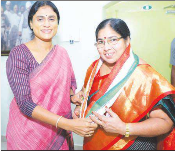
షల్ల సమక్షంలో కాంగ్రెస్లో చేరిన కూచిపూడి విజయ నేడు పాలన వ్యాపారంలా మారింది