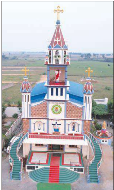
పెదకాకాని, మేజర్ స్టూన్ : ఆర్.సి.యం చర్చ్ నంబూరులో ఈస్టర్ పండుగ వేడుకలు ఘనంగా నిర్వహించారు. పండుగ సందర్భంగా చర్చ్