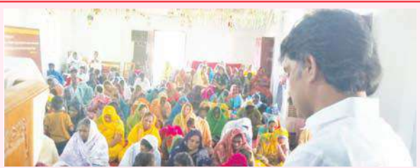
విశ్వాసులకు గుడ్ ఫ్రైడే సందేశం