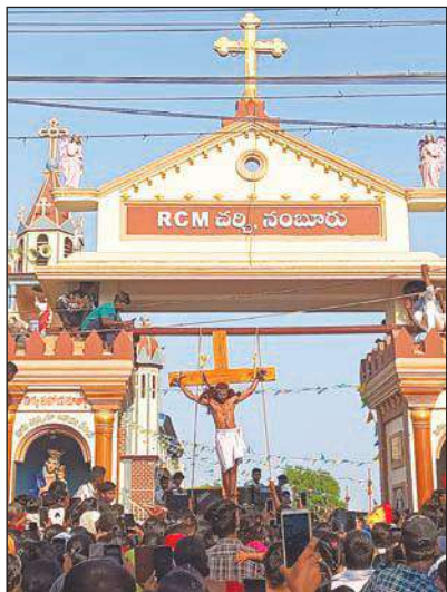
పెదకాకాని మేజర్ స్టూన్: ప్రపంచ మానవాళి శాంతి కోసం లోకరక్షకుడు ఏసు ప్రభు జీవితం అంకితమైందని త్యాగాలమయమైన ఆయన జీవిత క్రమం భవిష్యత్తు తరాలకు మార్గదర్శకమని ప్రతి ఒక్కరూ అనుసరించదగ్గ మార్గమని రెవరెండ్