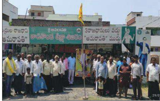
తాడికొండ, మేజర్ న్యూస్ : మండల కేంద్రమైన రాష్ట్ర వాణిజ్య విభాగం జనరల్ సెక్రెటరీ బండ్ల

తాడికొండలో తెలుగుదేశం పార్టీ 42వ ఆవిర్భావ దినోత్సవ వేడుకలను అమరావతి రాజధాని రైతుల దీక్ష శిబిరం వద్ద గురువారం ఘనంగా నిర్వహించారు. కార్యక్రమంలో పాల్గొన్న పలువురు నేతలు ఎన్టీఆర్ చిత్రపటానికి పూలమాలలు వేసి తెలుగుదేశం పతాకాన్ని ఎగురవేసి కార్యకర్తలకు శుభాకాంక్షలు తెలిపారు. ఈ సందర్భంగా