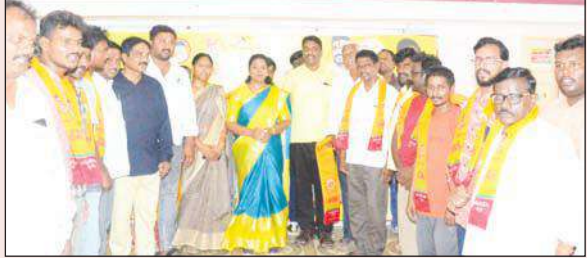
అరాచక పాలన ముగింపునకు సమయం వచ్చింది